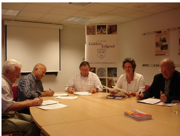
Foto: ondertekening addendum door collectiebeheerders

Het gaat om de volgende collectiebeheerders en preventienetwerken: