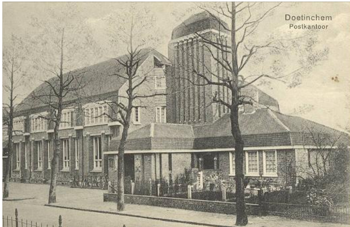
Het Postkantoor van J. Crouwel, 1920

In CODA startte in 2009 het project Historische Praatkaarten. Aan de hand van een pakket van 100 kaarten met historische afbeeldingen en vragen daarover praten ouderen met elkaar en eventueel met jongeren in het kader van hun maatschappelijke stage, over Apeldoorn vroeger en nu. Ze worden ook uitgezet in Apeldoornse verzorgingstehuizen en in het Alzheimer café. Er zijn nu drie sets historische praatkaarten in omloop gebracht, het aantal zal uitgebreid worden. CODA werkt in dit project samen met welzijnszorg Apeldoorn, een woningbouwvereniging en het bureau voor maatschappelijke stages.