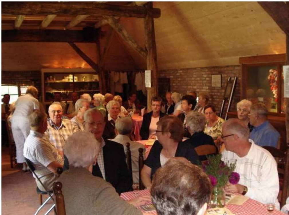
In de schob

We gaan verder, naar Brabant. In 2009 start daar, in de Meierijsche Museumboerderij in Heeswijk-Dinther, het ouderenprogramma 'Witte ge da nog?'