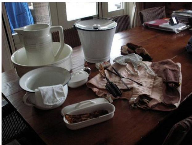
Persoonlijke verzorging vrouw

Na verloop van tijd werden vaste themakisten samengesteld zodat ook andere zorginstellingen daarvan konden profiteren. Het museum beschikt nu over 25 themakisten, zoals 'Schoonmaak', 'Tabak en roken', 'Persoonlijke verzorging vrouw', en 'Persoonlijke verzorging man'. Door ontwikkelingen binnen het regionale zorgbeleid is het project stil komen te liggen in 2009. Het museum heeft inmiddels een evaluatieonderzoek gedaan naar de projectervaringen en verdere behoeften van de aan het project deelnemende zorginstellingen.