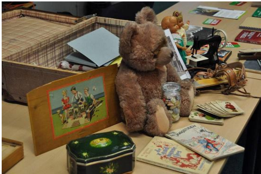
Koffer, thema 'als kind..'

Bij het programma 'Cultureel Erfgoed en Zorg' van onze zusterorganisatie Landschap Erfgoed Utrecht zijn twee freelancers betrokken en wordt er gewerkt met stagiaires. Het bestaat uit verschillende onderdelen. Er zijn koffers ontwikkeld voor zorginstellingen. In de koffers zitten foto's, geluidsfragmenten en voorwerpen uit de jeugd en eigen omgeving van de bewoners, en een handleiding. De materialen worden gekocht op rommelmarkten of in winkels met tweedehands spullen, maar er zitten ook bruiklenen van musea tussen. De koffers hebben thema's als: 'Handen uit de mouwen' en 'Als je haar maar goed zit' . Een