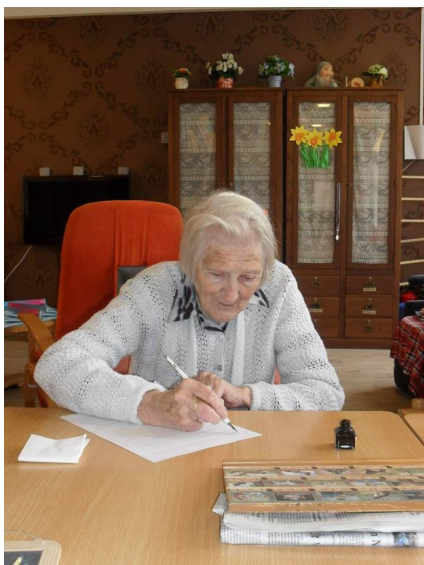
Schrijven met kroontjespen

Onze collega's in Noord-Holland startten in 2009 het project Tijd voor toen, met een woonzorgcentrum in Zaandam. Het project wordt gesubsidieerd door de gemeente Zaanstad voor vier jaar. Het gaat hier om reminiscentiekisten, een tentoonstelling en een vitrine die door bewoners zelf wordt ingericht. In het project worden inwoners van het woonzorgcentrum gevraagd hun eigen materialen, zoals foto's, films, voorwerpen en verhalen mee te nemen. De reminiscentiekisten worden ontwikkeld voor licht dementerende ouderen in zorginstellingen. Het project is gestart met het thema 'Onderwijs'. Andere kisten, die ontwikkeld worden, zijn: 'Trouwen', 'Bevrijding' en 'Molens'. Voor het stimuleren van het reminiscentieproject worden de thema's gecombineerd met activiteiten, zoals puzzelen, breien en schrijven met de kroontjespen. Reproducties en replica's worden gebruikt en er worden materialen via Marktplaats aangekocht.