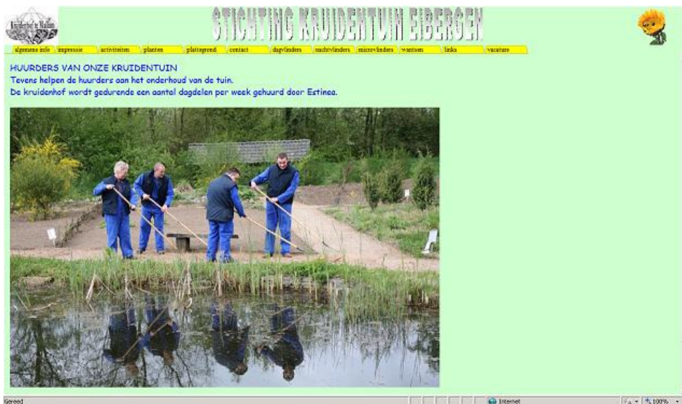
Website Kruidentuin Eibergen

In Gelderland hebben we een paar musea die zich richten op de historie van de geestelijke gezondheidszorg, zoals Museum Groot Graffel in Warnsveld en Historisch Museum APZ Wolfheze. Dat museum in Wolfheze is bezig met een nieuwe opzet. De doelstelling van het museum sluit aan bij die van koepelorganisatie Pro Persona om, naast het bieden van goede zorg en behandeling, ook de geestelijke gezondheidszorg meer bekendheid te geven binnen onze maatschappij, zodat drempels worden geslecht. Het museum werkt samen met het nationale museum op dit terrein, Het Dolhuys in Haarlem, met het netwerk van Nederlandse musea in de GGZ en het Florence Nightingale Instituut in Zetten, ook Gelderland.