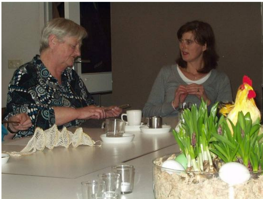
Thema Zuiderzeevervisserij, dagopvang

Gelders Erfgoed startte in 2006 een project Activering van senioren met stadsgeschiedenis en internet. Het project was een samenwerking tussen Gelders Erfgoed, Stadsmuseum Harderwijk en Stichting Welzijn Ouderen Harderwijk (SWO). Het project bestaat uit twee producten: een cursus bedoeld voor actieve senioren, en leskisten voor de dagopvang van Stichting Welzijn Ouderen. De cursus is gericht op zelfstandig wonende senioren, die door middel van kennis van de lokale stadsgeschiedenis op een nieuwe manier, via internet, sociaal geactiveerd worden. De cursus bestond telkens uit vier bijeenkomsten, waarin actieve senioren aspecten leren kennen van de (lokale) geschiedenis van de museumcollecties van Stadsmuseum Harderwijk en internet. Tijdens de cursus in een internetcafé is gebruik gemaakt van de website CollectieGelderland en van andere websites met historische informatie. Voor de cursus werd een oud geschiedenis-docent aangetrokken. De cursus is vanaf het tweede jaar gecombineerd met een stadswandeling, bezoek aan het museum, bibliotheek of gemeentearchief.