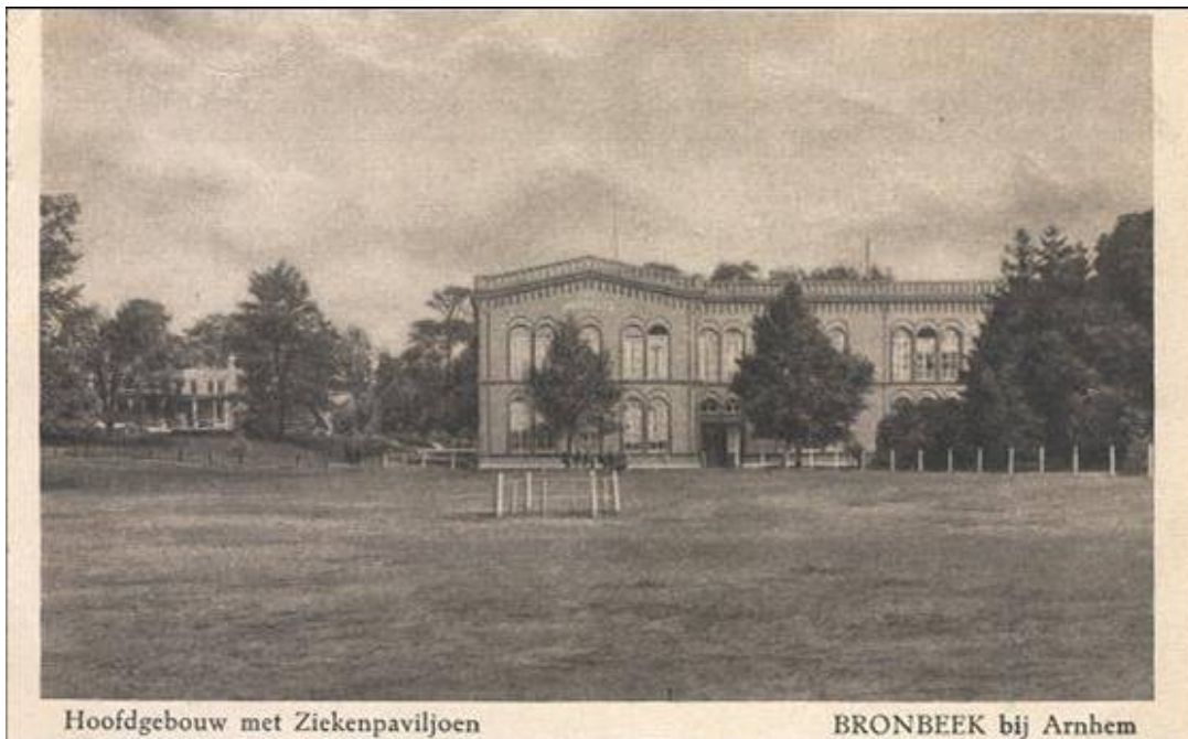
Hoofdgebouw met Ziekenpaviljoen

Stadsmuseum Doetinchem gaat verhuizen, zo is de bedoeling. In het nieuwe onderkomen komt een cross-over tussen erfgoed en zorg tot stand. Want in het gebouw wordt niet alleen de collectie gepresenteerd. Ook het Sociaal Cultureel Eetcafé Het Borghuis wordt in het nieuwe gebouw gevestigd. Het Borghuis fungeert dan tevens als museumcafé. Het Borghuis is een leer- en werkplek voor zo'n 20 personen uit de doelgroep voor mensen met een functiebeperking.