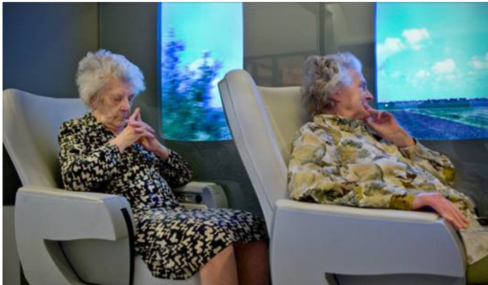
Cross-over tussen kunst en zorg, project Stichting Kunst in de Openbare Ruimte