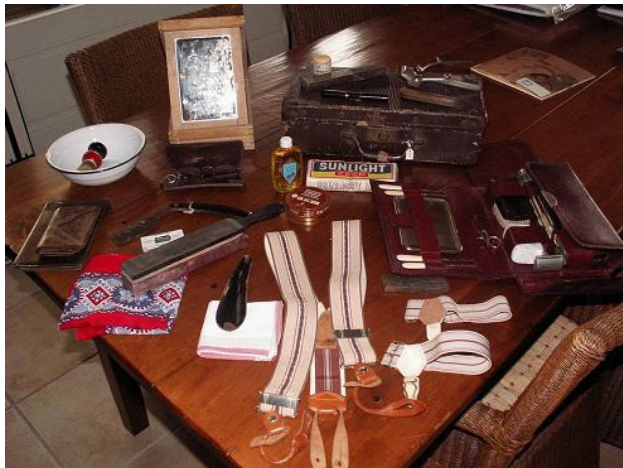
Persoonlijke verzorging man