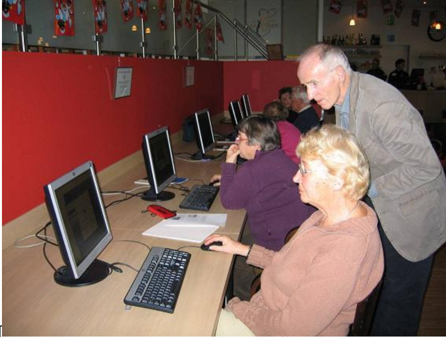
Cursus actieve senioren

In samenwerking met de dagopvang van Stichting Welzijn Ouderen worden tot op de dag van vandaag leskisten samengesteld op thema. Enkele algemene thema's zijn woonomgeving, familie, geloof, eten en drinken, en liefde. Voor de leskisten wordt gebruik gemaakt van een deel van de collectie van het museum, dat een rekvisieten status heeft. De activiteiten met de dagopvang worden gedaan met behulp van lokale geschiedenis om ouderen te helpen bij het trainen van hun geheugen met onderwerpen, die aansluiten bij hun persoonlijke ervaringen. Het totaalproject kun je bestempelen als een soort preventiegerichte welzijnsactiviteit.