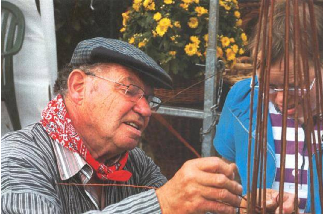
Samen aan de slag, Overasselt

Een project dat volop in ontwikkeling is, is 'Zorg en museum onder één dak'. In Overasselt wordt boerderij 'De Lage Hof' omgebouwd tot museum waarin de collectie van het huidige Agrarisch Museum De Garstkamp een plek krijgt. Dat museum gaat een belangrijke rol spelen in de Buurderij. Er komt accommodatie voor kleinschalig groepswonen met zorg, voor mensen met dementie en mensen met een verstandelijke beperking. En een multifunctioneel centrum met het museum, moestuin en boerderijdieren, dagbesteding voor ouderen en een steunpunt voor activiteiten gerelateerd aan de WMO (Wet Maatschappelijke Ondersteuning) zoals ontmoeting, informatie en advies.