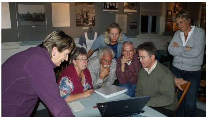
Historisch Museum Wolfheze

De Buurderij wordt een plek voor integratie en ontmoeting van mensen die om diverse redenen kwetsbaar zijn geworden in de samenleving. Verschillende partijen werken hier samen: de gemeente Heumen, het centrum voor welzijn, wonen en zorg, een woningcorporatie, een instelling voor mensen met een verstandelijke beperking en het museum. Men gaat specifieke activiteiten aanbieden voor bewoners uit het zorgcentrum maar ook voor familieleden. Zo kan het 'verplichte' zondagse bezoek een andere dimensie krijgen en de jongere generatie een onverwachte kijk geven in het leven van hun moeder of grootmoeder.